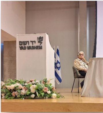
שכבת ה' ערכה סיור לימודי ביד ושם