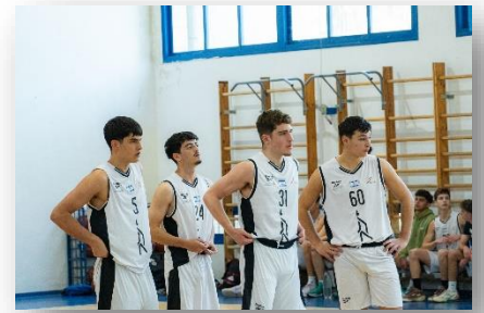
משחק כדורסל של נבחרת הבנים