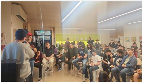
לילה לבן שעסק בבחירות לנשיאות ארצות הברית