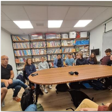
תחילת פעילות מועצת התלמידים