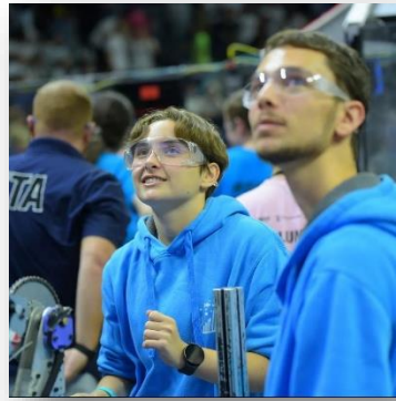
נבחרת הרובוטיקה בתחרות offseason