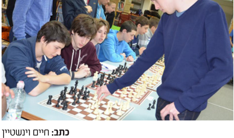
כתב: חיים וינשטיין